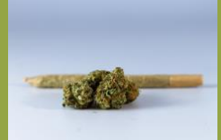
زهرة / سجائى حشيش