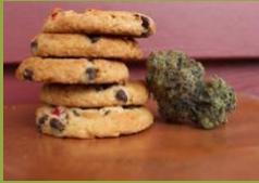
Vilaji venye bangi