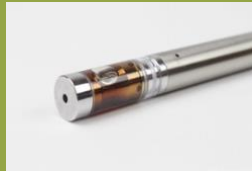
Kalamu za mvuke